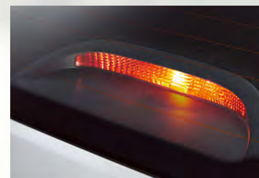
Đèn báo phanh trên cao