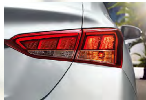
Đèn hậu công nghệ LED 3D