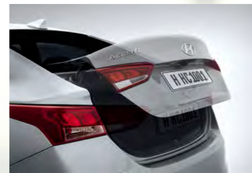
Cốp mở thông minh khi chìa khóa đến gần