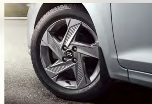
Lazang hợp kim 16 inch (Với phiên bản AT Đặc Biệt)