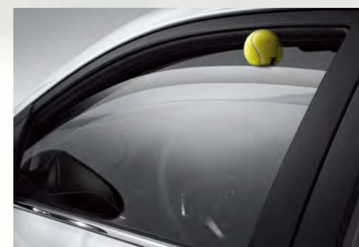
Cửa sổ chỉnh điện chống kẹt