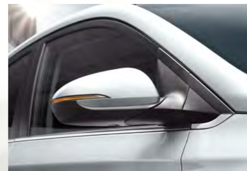
Đèn báo rẽ LED tích hợp trên gương