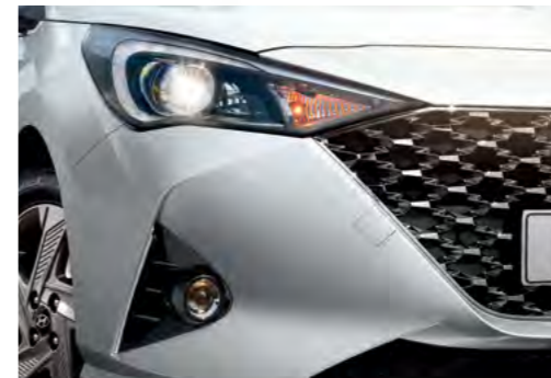
Dải đèn LED ban ngày DRL