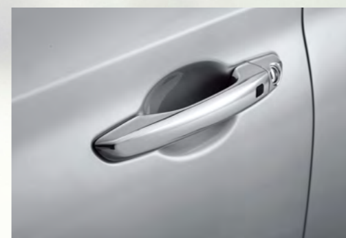
Tay nắm cửa mạ Crom