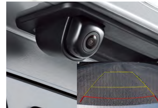
Camera lùi, kết hợp với cảm biến sau xe