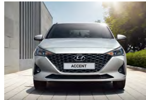
Thiết kế lưới tản nhiệt mạ crôm đen kết hợp các khối hình đan xen nhau

Thiết kế mới của Hyundai Accent là một cuộc cách mạng, đem đến vẻ đẹp hấp dẫn của sự kết hợp giữa hiện tại và tương lai. Lưới tản nhiệt bắt mắt với các khối hình đan xen, táo bạo và lớp mạ crôm tạo nên sự cao cấp. Đèn định vị LED với hệ thống chiếu sáng projector giúp bạn quan sát rõ hơn vào ban đêm đồng thời mang đến nét tinh tế công nghệ cao.