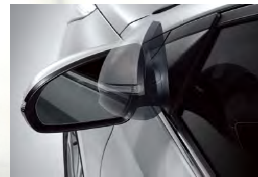
Gương chiếu hậu gập chỉnh điện