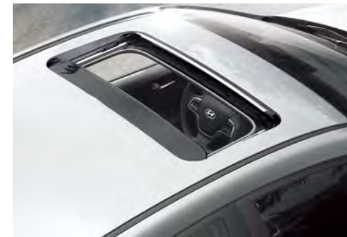
Cửa sổ trời điều khiển điện (Với phiên bản AT Đặc Biệt)